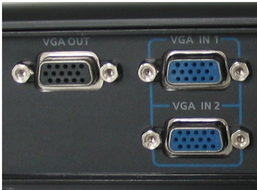
Imagen 2: Las conexiones VGA en un proyector típico.

i Ya deberías ver la imagen en el proyector.