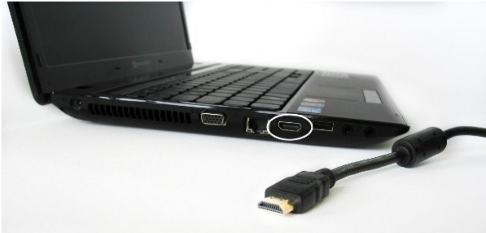
Imagen 5: Un ordenador portatil con conexión HDMI.