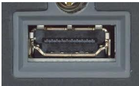
Imagen 4: Conector HDMI.