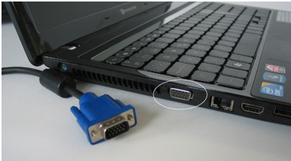
Imagen 1: Un ordenador portátil con conector VGA.

AVISO: Si tu vídeo o presentación incluye música o tiene sonido deberías tener un sistema de audio adicional (altavoces autoamplificados, equipo de música o similar).