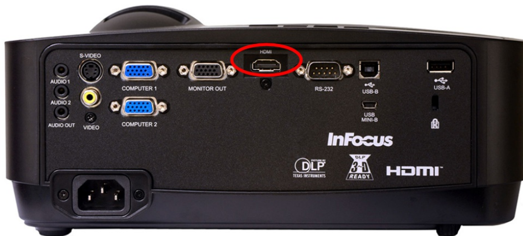
Imagen 6: Conector por puerto HDMI.