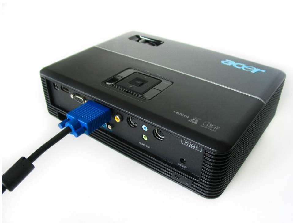
Imagen 3: Un proyector conectado usando un cable VGA.

i Ya deberías ver la imagen en el proyector.